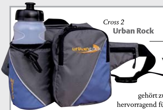
Cross 2 Urban Rock

Praktisch, klein und fast schon unverzichtbar sind die kleinen, trendigen Hüfttäschchen von Urban Rock. Auch eine dünne Softshelljacke sollte Platz finden. Die Trinkflasche gehört zum Lieferumfang. Cross 2 eignet sich hervorragend für alle Unternehmungen, für die ein Rucksack zu groß ist und bei denen man die wichtigsten Sachen, wie Handy, Geldtasche oder Fotoapparat mitnehmen möchte.