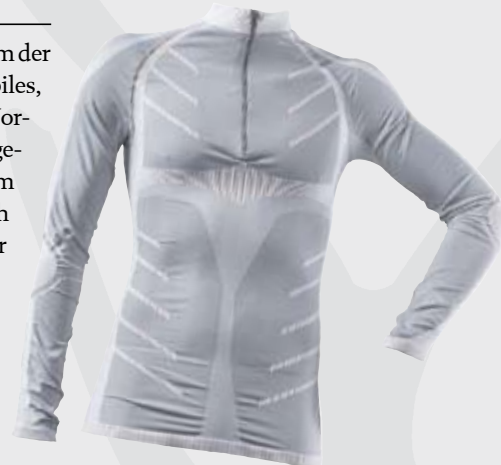
Ergo Seamless Mens Undershirt Northland

Die Ergo-Seamless-Unterwäsche von Northland Professional ist besonders für Aktivsport zu empfehlen. Durch das Jacquard-Strick-Verfahren ist sie in den unterschiedlichen Körperzonen perfekt abgestimmt. Die Schultern dehnen sich und der Bauchbereich wird gestützt. So macht das Shirt wirklich alle Bewegungen