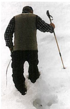
Foto 1: Auf der Suche nach dem Eisrand am Wildgerloskees, 1. 10. 2001