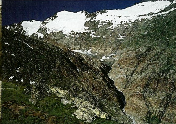
Foto 5: Vergleichsaufnahme am 27. 7. 2001. Die über 200 m mächtige Zunge des Gurgler Ferners ist in diesem Talabschnitt zur Gänze abgeschmolzen

Gletschern der Ötztaler Stubai Alpen konnten neuschneebedingt nur von 3 Zungenenden Messwerte gewonnen werden. Der Bachfallen Ferner ist wegen des vorgelagerten Sees noch immer nicht zugänglich. Der Gaiskar Ferner war zu stark schneebedeckt, der Triebenkarbar Ferner wurde deshalb nicht mehr aufgesucht. Der Mittelwert der 3 Gletscher ist mit -13,8 m etwas größer als im Vorjahr.