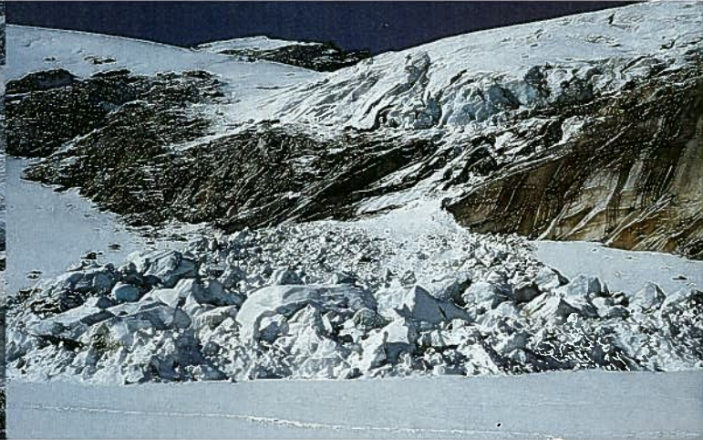
Foto 2: Der Fürlegg-Eisbruch des Somblickkeeses am 7. 8. 1986