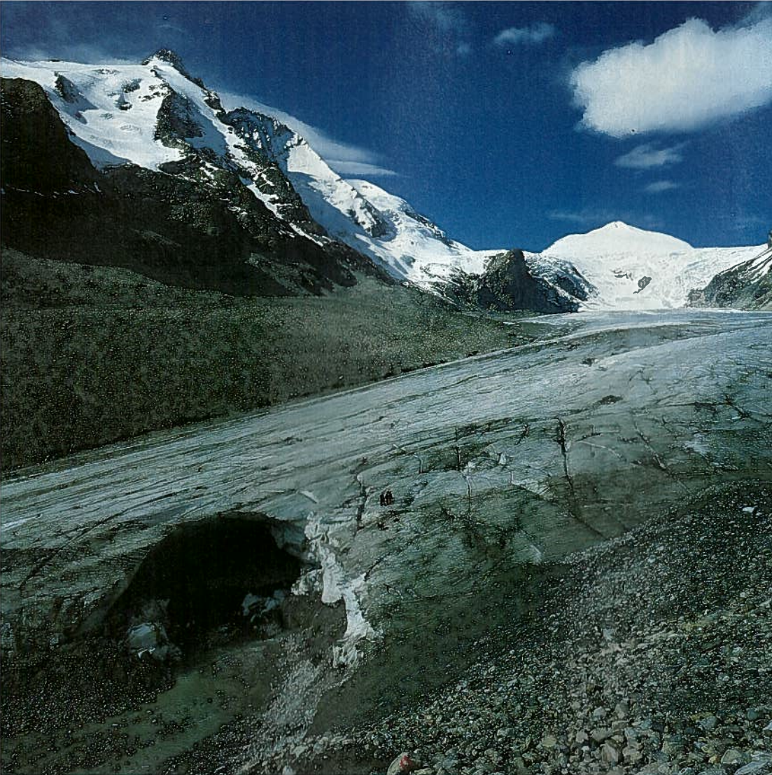
Gletschertor an der Pasterze mit Großglockner und Johannesberg (6. 10. 2001)