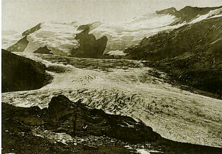
Foto 4: Der Gurgler Ferner (Ötztaler Alpen) im Jahre 1868, 3 Jahre nach dem Höchststand von 1865