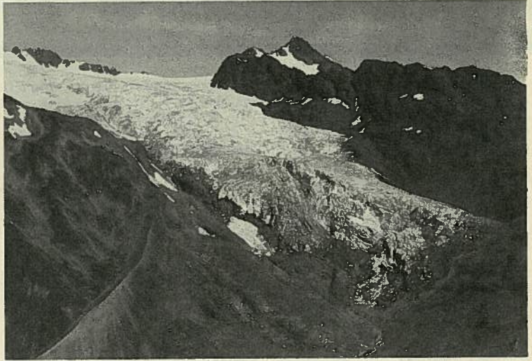
Der Kesselwandferner (Öztaler Alpen), im vollen Vorstoß, 1977 (Heralt Schneider)

Obwohl bis weit herunter viele Altschneeflecken lagen, konnten die 27 vorhandenen Marken einwandfrei nachgemessen werden. Von sieben gemessenen Gletschern waren sechs vorgerückt, nur der Mittelbergferner hatte sich im Mittel um 0,8 m zurückgezogen. Das Gebietsmittel der Längmessungen ergab einen Vorstoß von 4,2 m gegenüber 3,43 m im Vorjahre. Am größten war der Vorstoß mit 11,3 m am Taschachferner, dessen Zunge sich nun seit 1972 bereits um 61,65 m verlängert hat. Das schon in den letzten Jahren zerstörte Wasserbecken der Braunschweiger Hütte wird von der 40 bis 50 Grad steilen Stirn des Karlesferners weggeschoben.